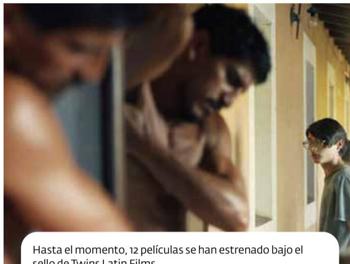
Hasta el momento, 12 películas se han estrenado bajo el sello de Twins Latin Films.

las. Eso no significa que voy a hablar del Alzheimer, más bien de personas que están atravesados por situaciones. Otro ejemplo es la deshumanización del capitalismo y se puede ver en el Joker , un personaje que existe hace 70 años, es una víctima del sistema, tiene un problema de salud mental y el cual el sistema le da la espalda. Es decir, aborda un tema de agenda global, entonces es relevante para la gente. Los temas de agenda global no se agotan en una tendencia, son temas que perduran.