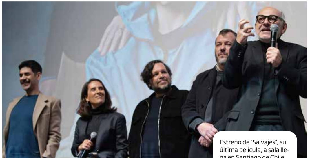
Estreno de "Salvajes", su última película, a sala llena en Santiago de Chile

Por ejemplo, fuimos a un mercado en España, y en las plataformas están buscando dramas, comedias dramáticas o romance y los productores están desesperados viendo cómo forzar un guión que tienen para meterlo en una historia romántica. Hay como una desesperación para ver cómo podemos contentar a las plataformas y la realidad es que no se puede. Lo ideal es poder tener una oferta variada de contenidos, y a veces calzara uno o será el momento de otro. Lo que sí podemos hacer es tratar de traer proyectos con historias que manejan una agenda global. Por ejemplo, la salud mental es un tema de agenda global y a la vez se puede ver en un montón de pelícu-