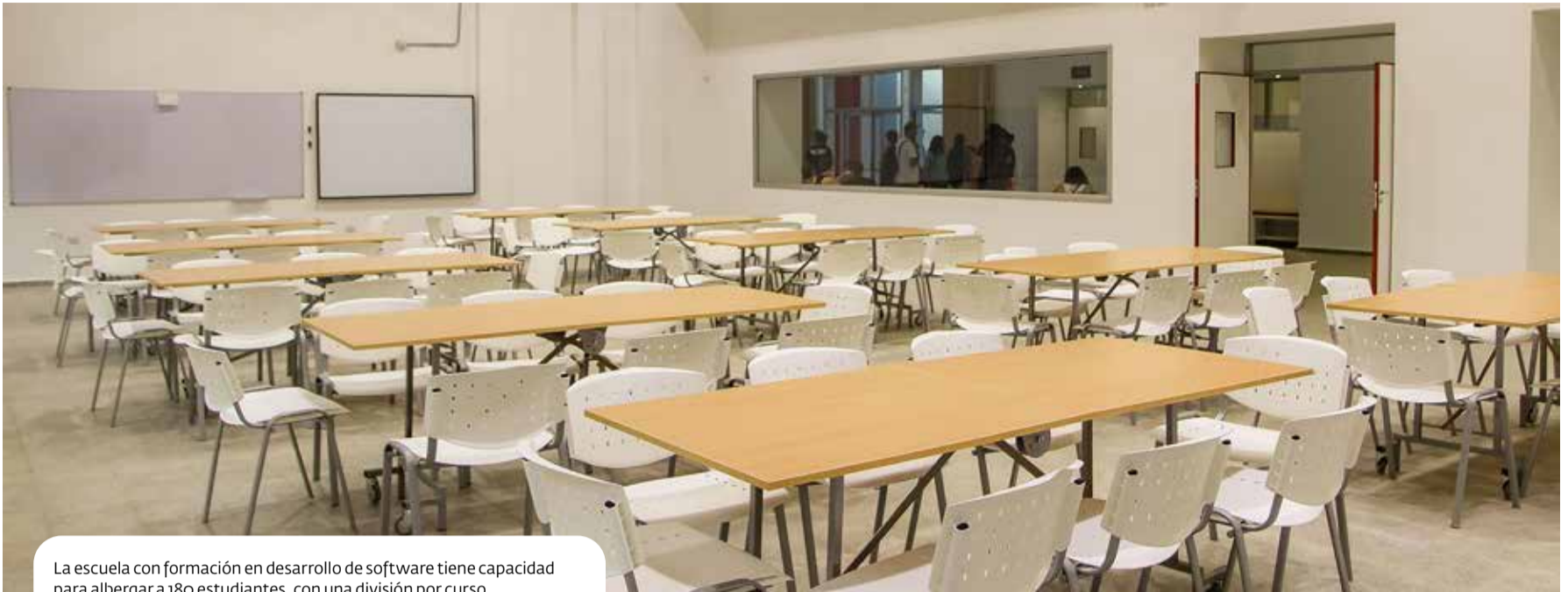
La escuela con formación en desarrollo de software tiene capacidad para albergar a 180 estudiantes, con una división por curso.