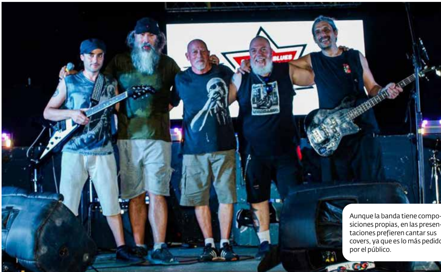
Aunque la banda tiene composiciones propias, en las presentaciones prefieren cantar sus covers, ya que es lo más pedido por el público.

Desde entonces, la banda ha atravesado cambios en su formación y hasta en su nombre. Antes de llamarse Desertores, se conocían como Gato Negro, en referencia a un tema de Pappo. Sin embargo, una serie de