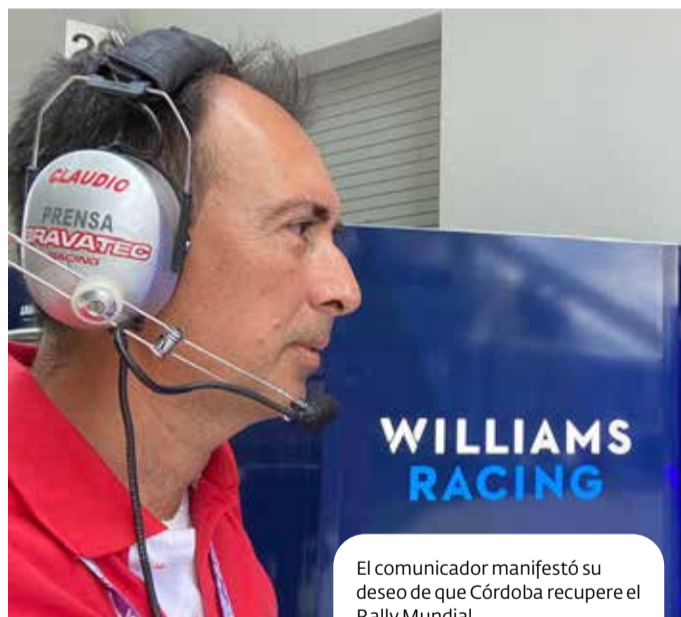
El comunicador manifestó su deseo de que Córdoba recupere el Rally Mundial.

muchos sucesos, como las elecciones presidenciales y me tocó cubrir esa parte de cómo se vive aquí y que interesan a nuestro país y al resto del mundo. También sucedió que cuando yo llegué a Estados Unidos, hace 5 años, a la semana de estar viviendo acá en Miami, se cayó un edificio muy importante y me tocó cubrir casi durante una semana para muchísimos medios.