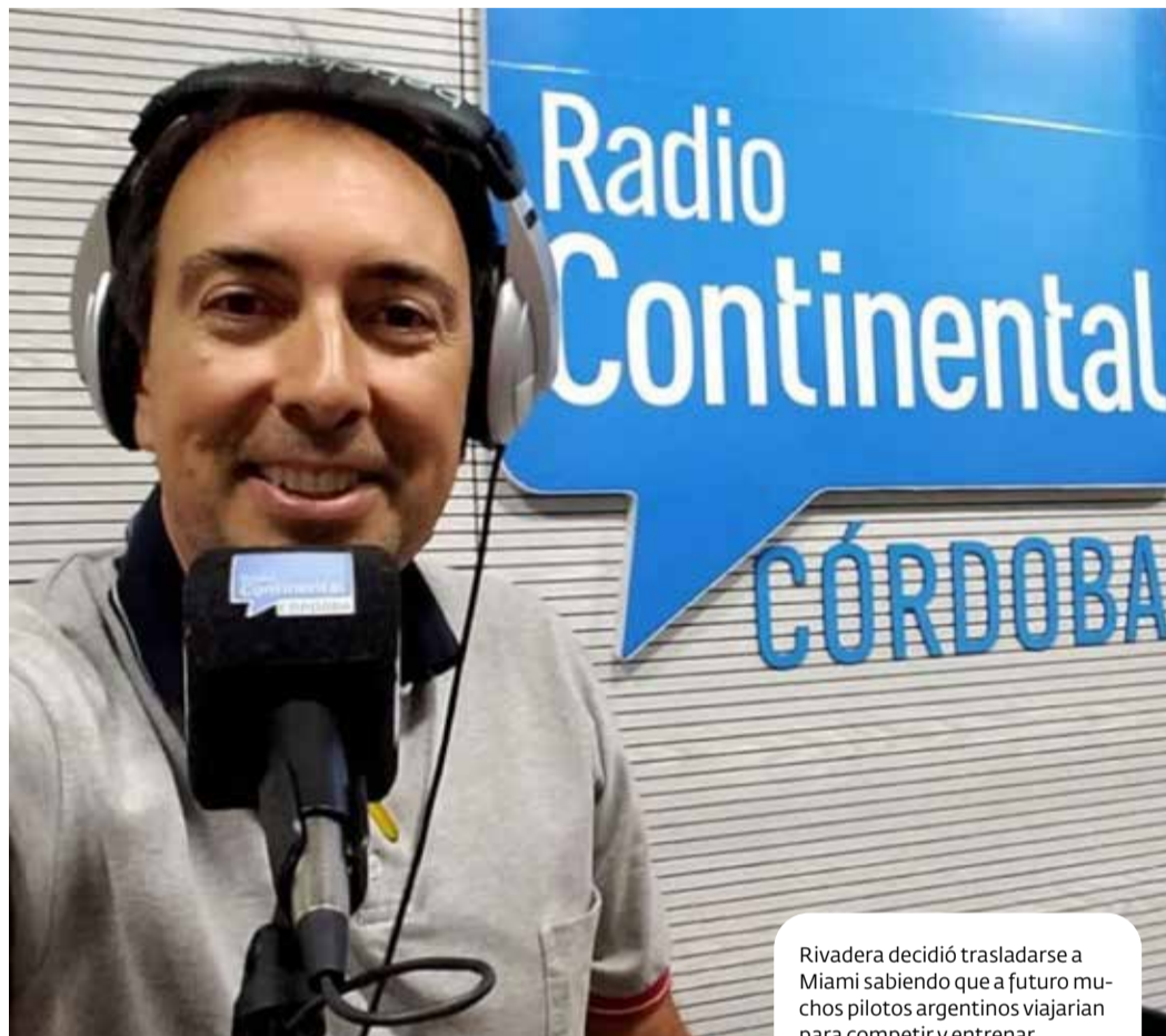
Rivadera decidió trasladarse a Miami sabiendo que a futuro muchos pilotos argentinos viajarían para competir y entrenar.

CR: No, y ahí entra la parte periodística mía. Por ejemplo, aquí en Estados Unidos, ocurren muchos acontecimientos y