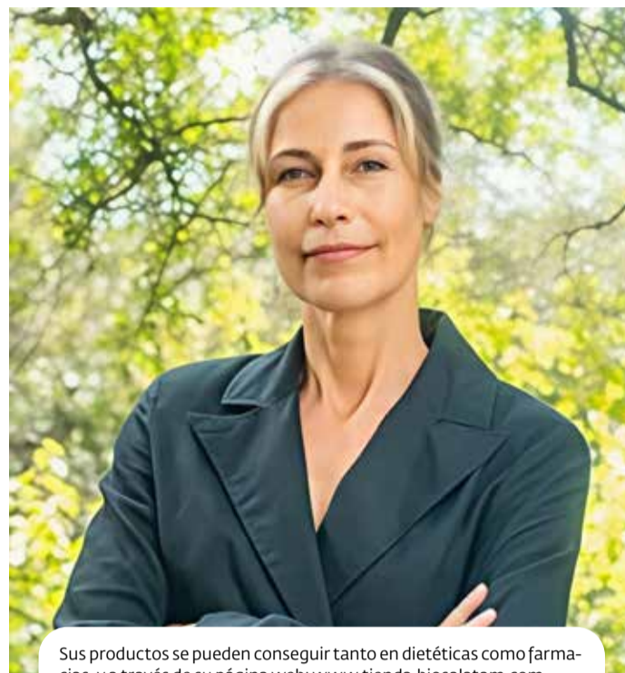
Sus productos se pueden conseguir tanto en dietéticas como farmacias, y a través de su página web: www.tienda.biosalatam.com

PC: Es un líquido súper concentrado en una botella de medio litro. Se toman 30 mililitros diarios, ya que esa proporción tiene la cantidad de microor-