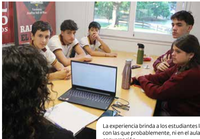
La experiencia brinda a los estudiantes la oportunidad de conocer temas o personas con las que probablemente, ni en el aula ni en sus vidas cotidianas, tendrían una conversación.

Los estudiantes del Ciclo Orientado comenzaron sus pasantías en los medios de comunicación del colegio: Periódico El Milenio y Radio El Milenio. En el área de gráfica, participan en la producción del periódico impreso, mientras que