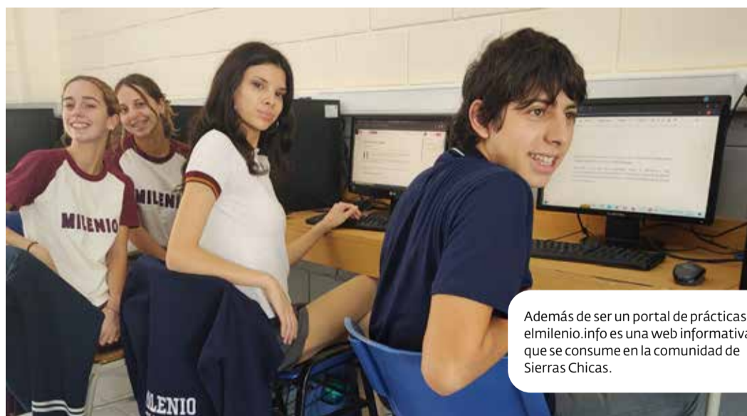
Además de ser un portal de prácticas, elmilenio.info es una web informativa que se consume en la comunidad de Sierras Chicas.