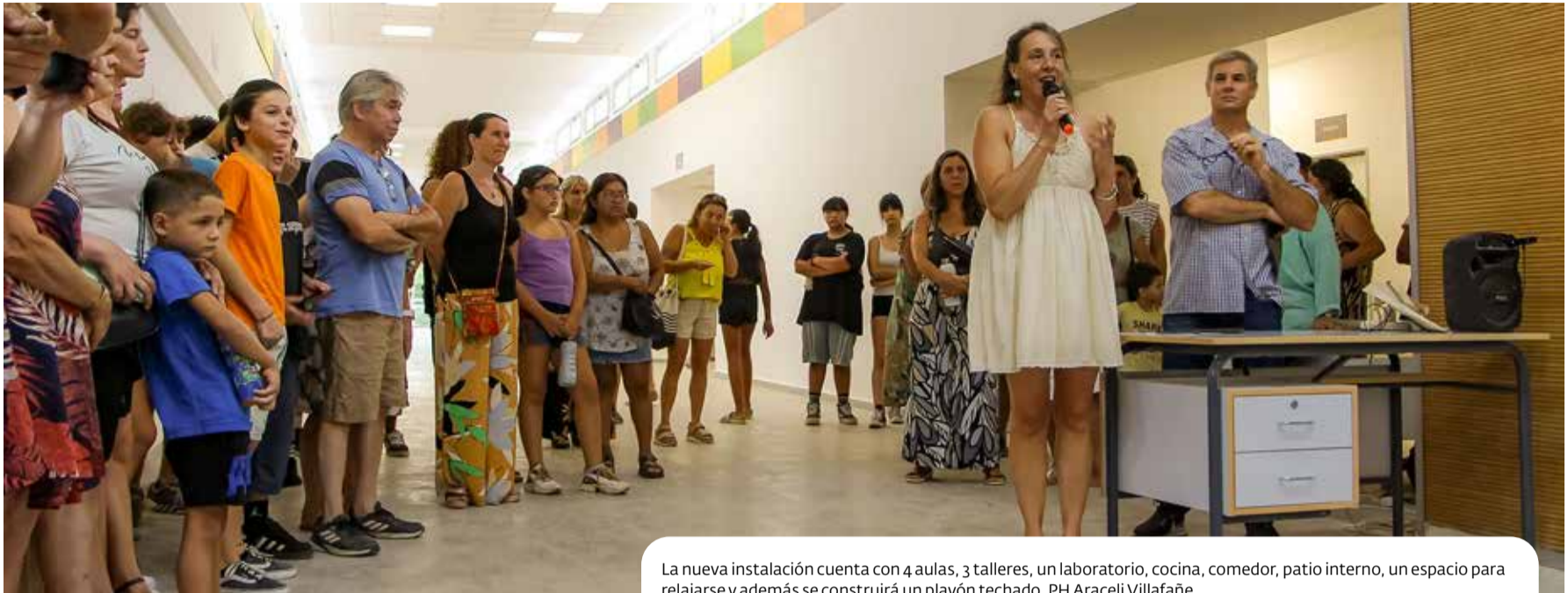
La nueva instalación cuenta con 4 aulas, 3 talleres, un laboratorio, cocina, comedor, patio interno, un espacio para relajarse y además se construirá un playón techado.