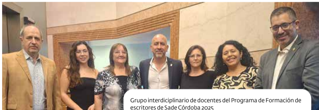
Grupo interdisciplinario de docentes del Programa de Formación de escritores de Sade Córdoba 2025

MG: Antes, la SADE era muy independiente, se manejaba so-